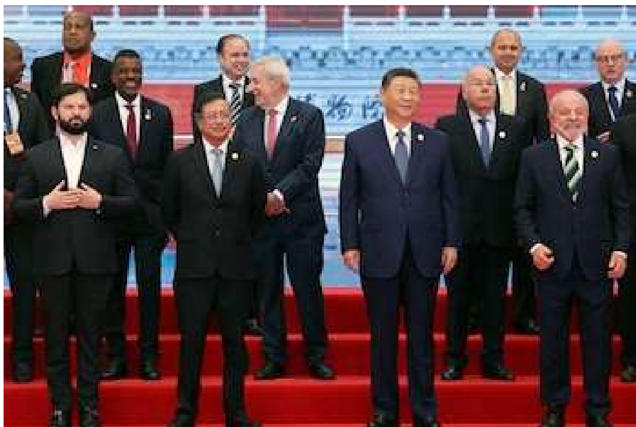
El presidente chino, Xi Jinping, el presidente brasileño, Luiz Inácio Lula da Silva, el presidente chileno, Gabriel Boric, y el presidente colombiano, Gustavo Petro, posan para una foto de grupo antes de la ceremonia de apertura de la reunión ministerial del

En lo que respecta a la “Iniciativa de Seguridad Global” de China, el documento dedica una amplia sección a la colaboración en materia de seguridad , que la República Popular China denomina su “Programa de Paz” . Aunque en documentos anteriores se han mencionado las actividades relacionadas con la seguridad de China en la región, el nuevo documento va mucho más allá, dando su bendición a la ampliación de la formación militar, los intercambios y las actividades en la región , incluidas las que involucran a personal policial y judicial . Se basa en las declaraciones de intenciones del plan China-CELAC 2025-2027 , comprometiéndose a ampliar la colaboración en materia de aplicación de la ley con la región. El documento menciona específicamente las actividades previstas en materia de lucha contra la corrupción, el lavado de dinero y la ciberdelincuencia .